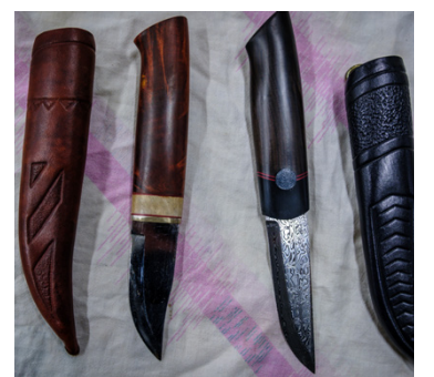
Här är några exempel på knivar som tillverkats under kursen genom åren.