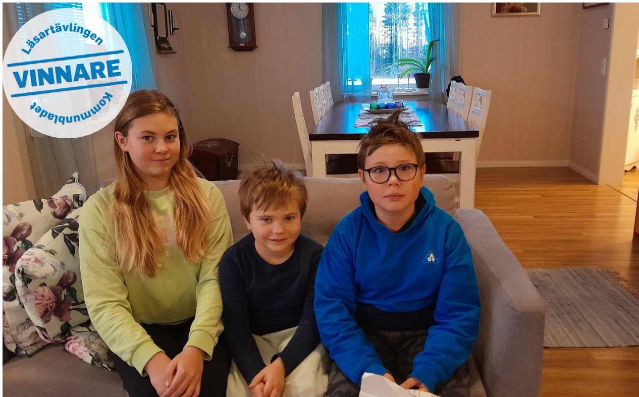
Syskonen Johansson ser framemot att börja julpynta så småningom.

Rätt svar: I förra läsartävlingen gäddle det att hitta bilderna på sidorna 3, 5, 13 och 15.