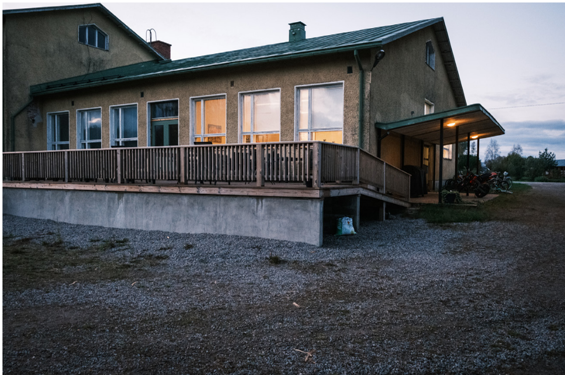
Då verksamheten låg i dvala under pandemin byggde Komossa UF en altan.