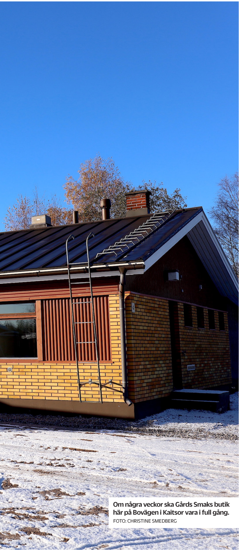
Om några veckor ska Gårds Smaks butik här på Bovägen i Kaitsori vara i full gång.