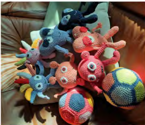
Andrejeff-Hahka har virkat de populära barnfigurena Babblarna.