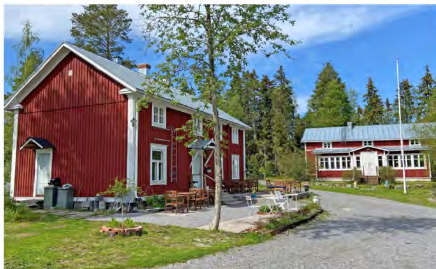
I hotellbyggnaden har alla rum ytrenoverats och fräschats upp med nya, lokaltillverkade sängar och restaurerade möbler.

enskilda eller privata grupper. Vi ordnar möten, familjefester och utflykter med övernattnings, måltider, konferenstjänster, bas-