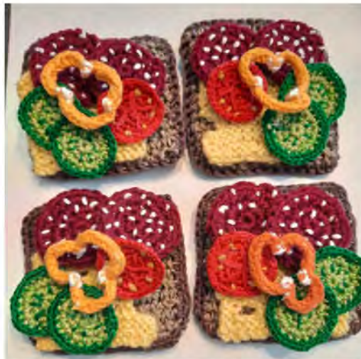
Virkade smörgåsar som Andrejeff-Hahka tillverkat. De är populära hos de yngsta i släkten.

”Förutom att få ögonen att se naturliga ut. Det är väldigt svårt. Jag måste ju erkänna att det inte är mina egna mönster. De fanns i en handarbetsbok på Vörå bibliotek.”