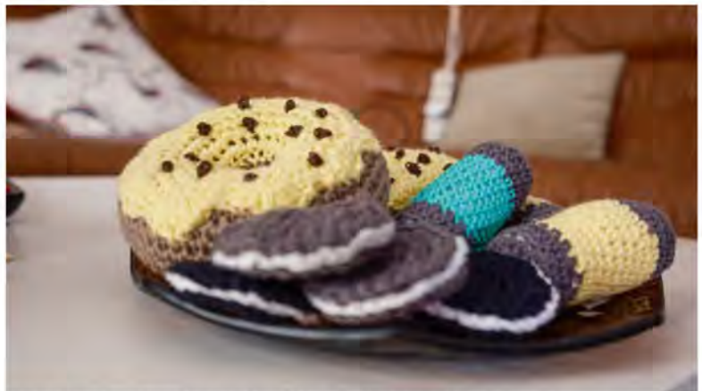
De yngsta barnbarnsbarnen har önskat sig virkade pizzor, bröd, sallader och munkningar.