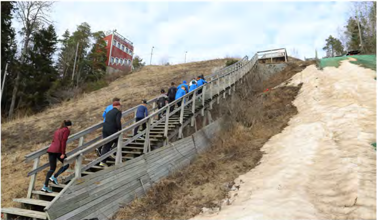
Trappträning kan göras vid både motionstrappor och vanliga trappor. Eftersom man inte behöver extra utrustning är det ett lätt sätt att få upp pulsen och förbättra benstyrkan.