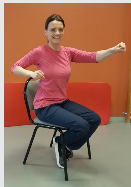
Boxning framåt och till sidorna Sjung: Vintern rasat ut bland våra fjällar