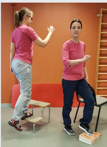
Tramp steg upp - ner Sjung: I naturen ut vi gå, jopphejdi