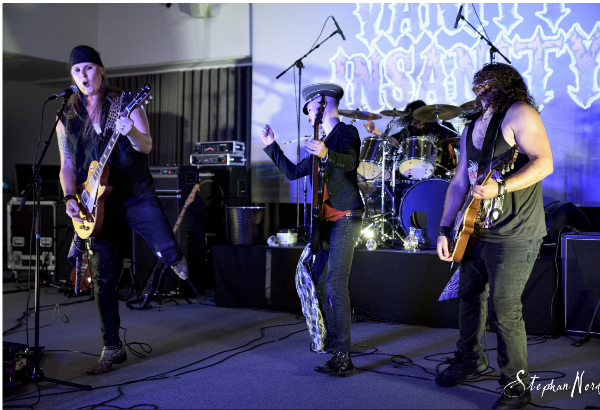
Bandet släpper nya låtar digitalt på bland annat Youtube och Spotify under november. Låtarna är inspelade på liknande sätt som man gjorde förut.