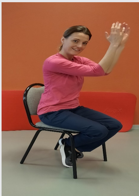
För ihop armbågarna framåt, runda rygg, räta upp dej sträck armarna bakåt utåt Sjung: Vem kan segla förutan