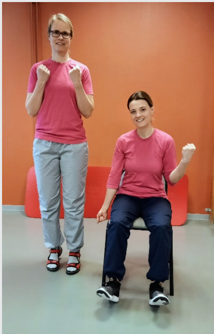
Knyt och spreta med fingrarna, böj och sträck i vristerna. Trampa på stället Sjung: Vi gå över daggstänkta