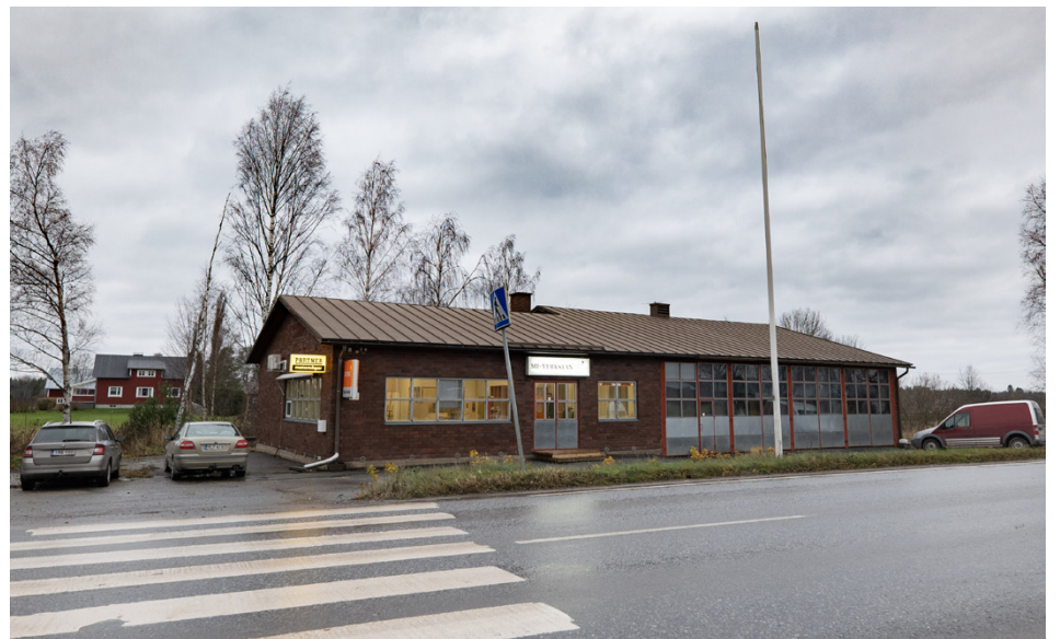
Den här delen som MI hyr är byggd på 1980-talet, men ursprungliga verkstaden byggdes redan före kriget på 1930-talet. Så det har funnits verkstad på tomten ganska länge.