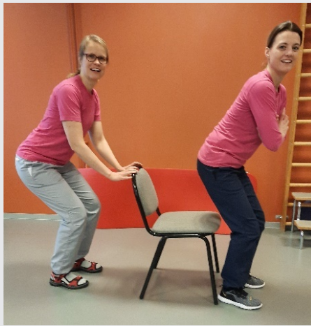
Sätt dej ner och res dej upp eller bara nästan många gånger Sjung När solen tänder sina strålar