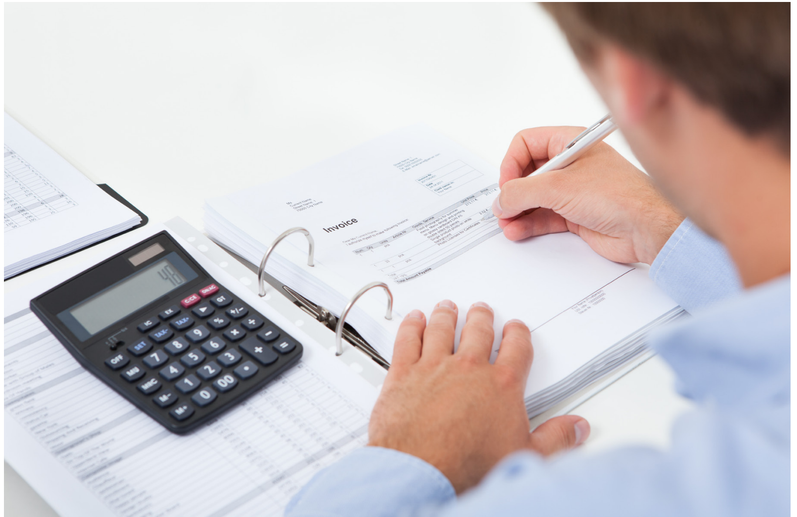
Det gäller att bland annat noga följa med inköps- och försäljningsreskontran och gör upp en realistisk kassaflödesberäkning.

4) Konkurrensutsätt upphandlingar och varuleveran-