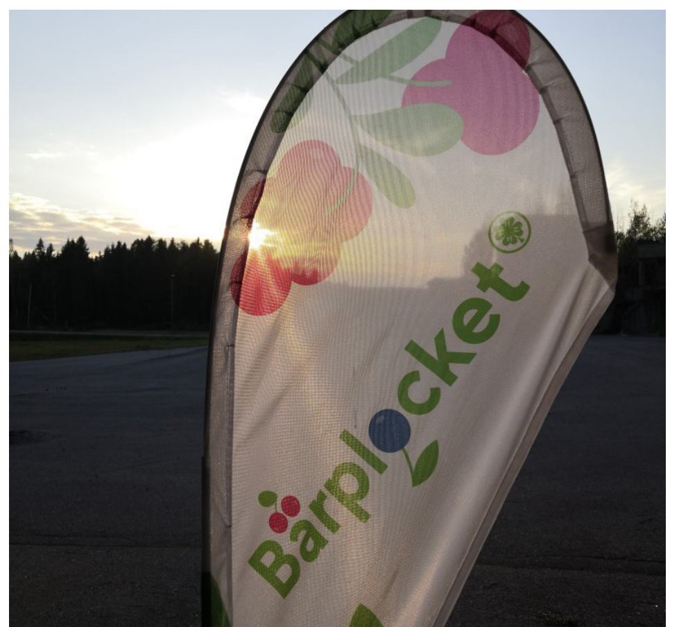
Bärplocket pågick i 4H-föreningarna i Korsnäs, Korsholm, Vörå och Pedersöre.

– Vi har kunnat uppmana individer inom vårt verksamhetsområde att gå ut i skogen och plocka bär. Moroten har kanske varit den där extra slanten, men resultatet har varit mer än det, lyfter Chatarina Doktor, verksamhetsledare för Vörånejdens 4H.