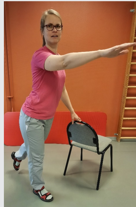
Sträck turvis motsatt ben bakåt och armen snett framåt uppåt Sjung: En sommardag i Kangasala