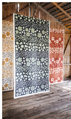
Mönstret Kukkaketo.