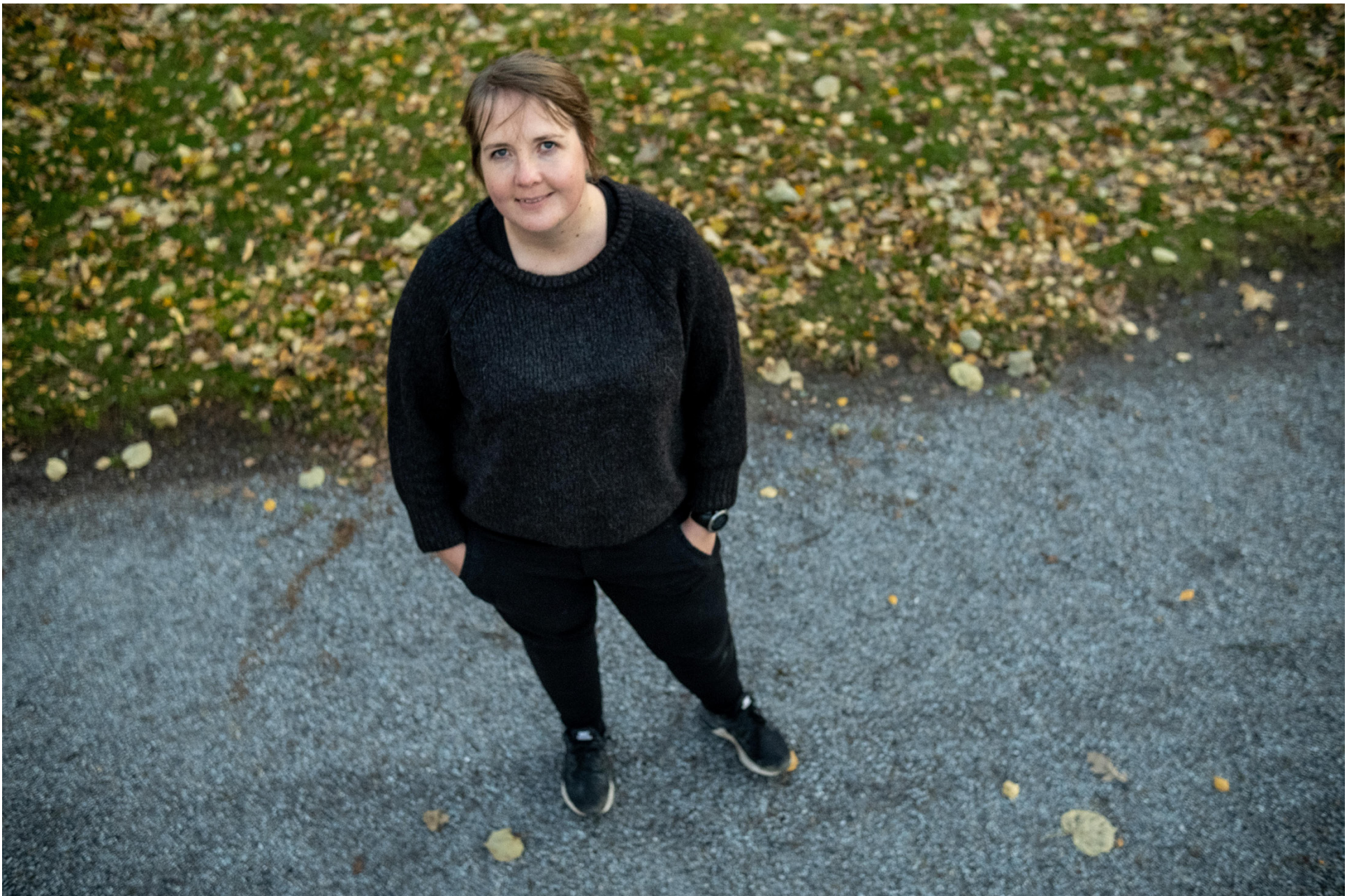
Krokvik minns särskilt bra första gången agenten och några större kunder kom på besök till Österbotten.