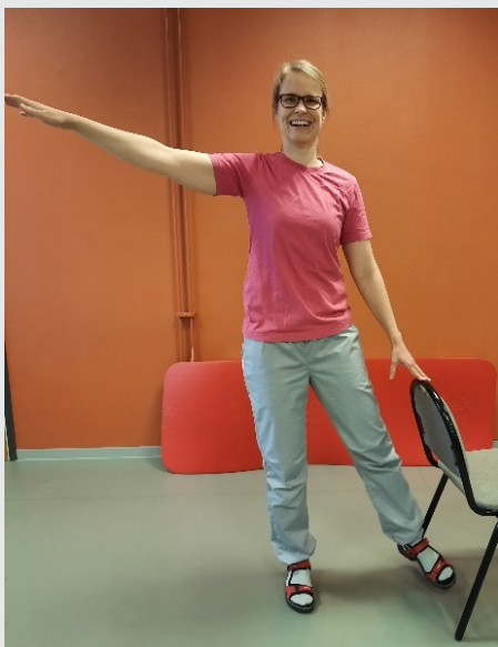
Sträck nu ut till sidan motsatt ben och arm. Fortsätt sjung