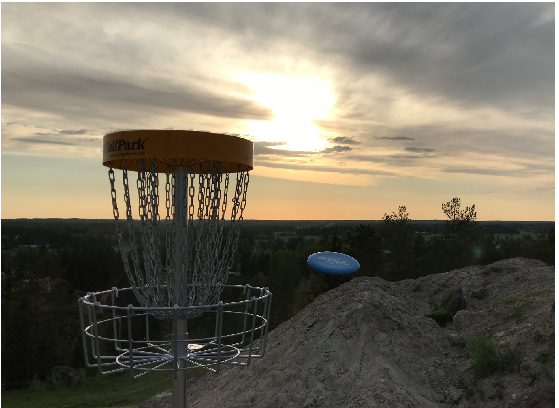
Banan är placerad i och runt slalombacken, och är den hittills mest fysiskt krävande frisbeegolfbanan i nejden.