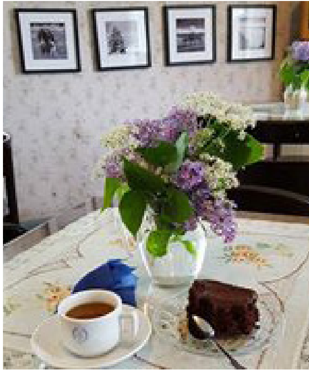
Café Klemetsgårdarna öppnade på midsommarafton och håller öppet till mitten av augusti. Där kan man avnjuta kaffe med hembakat, glass och handla lokalproducerade produkter.

Café Klemetsgårdarna öppnade på midsommarafton och håller öppet till mitten av augusti. Där kan man avnjuta kaffe med hembakat, SIA-glass och handla lokalproducerade produkter.