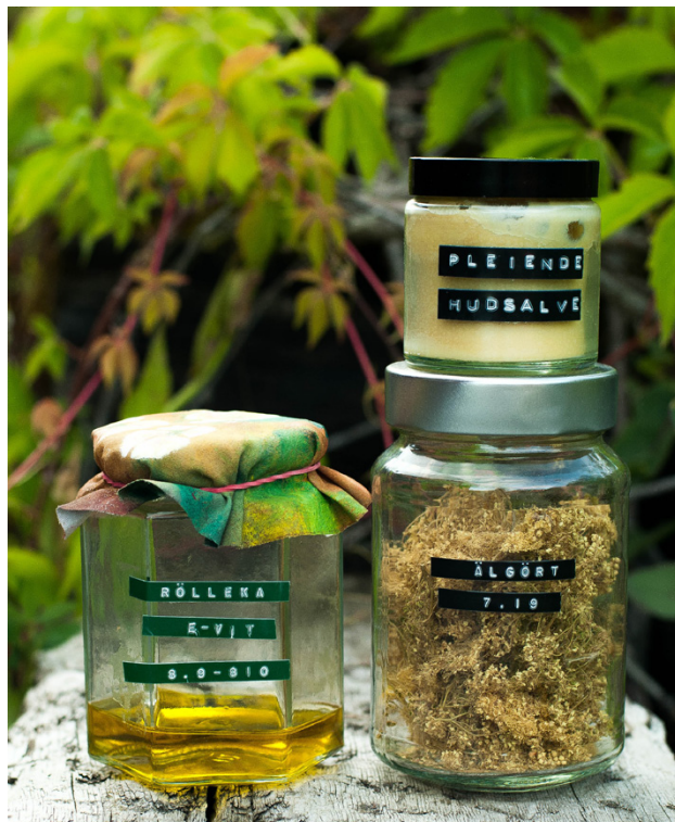
Att lära sig om växterna är ytterst viktigt när man börjar använda sig av dessa, detta för att exempelvis inte blanda ihop icke-giftiga växter med giftiga växter.

– Vill man börja försiktigt är det ju väldigt vackert med kakor och tårter pyntade med vilda, ätbara växter, säger Fanny Storlund.