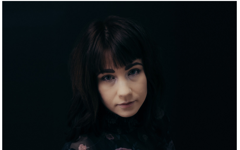
Henna berättar om att när det kommer till kreativitet, så kan man uttrycka sig på så många olika vis.