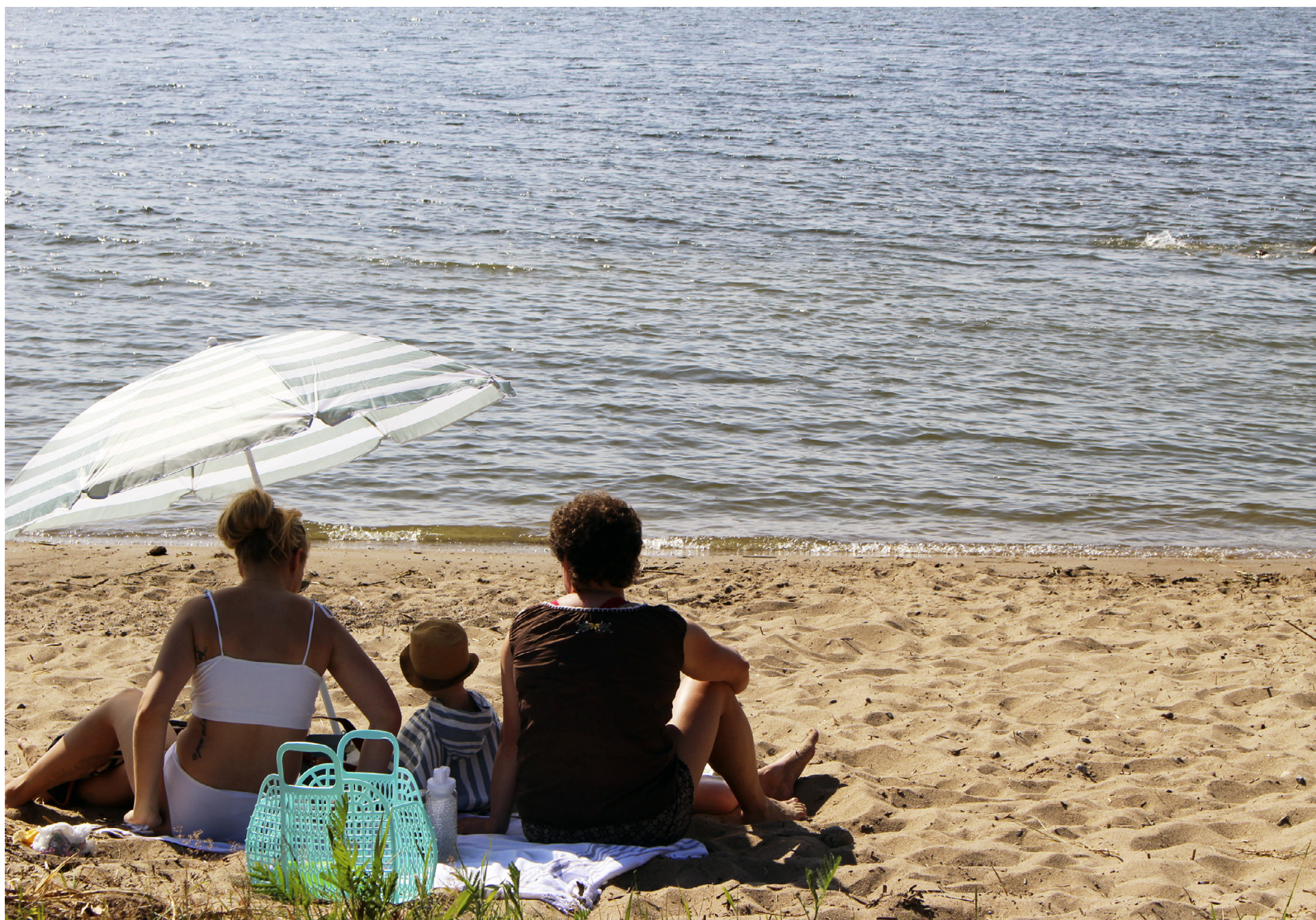
Sommar och sol, sand mellan tårna. Finns det något bättre?