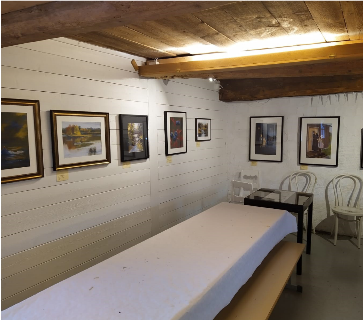
Nytt för i år är en konstutställning med akvarellmålningar av Annika Östman och en utställning av Finlands presidenter där besökarna har möjlighet att testa sina kunskaper om dem.