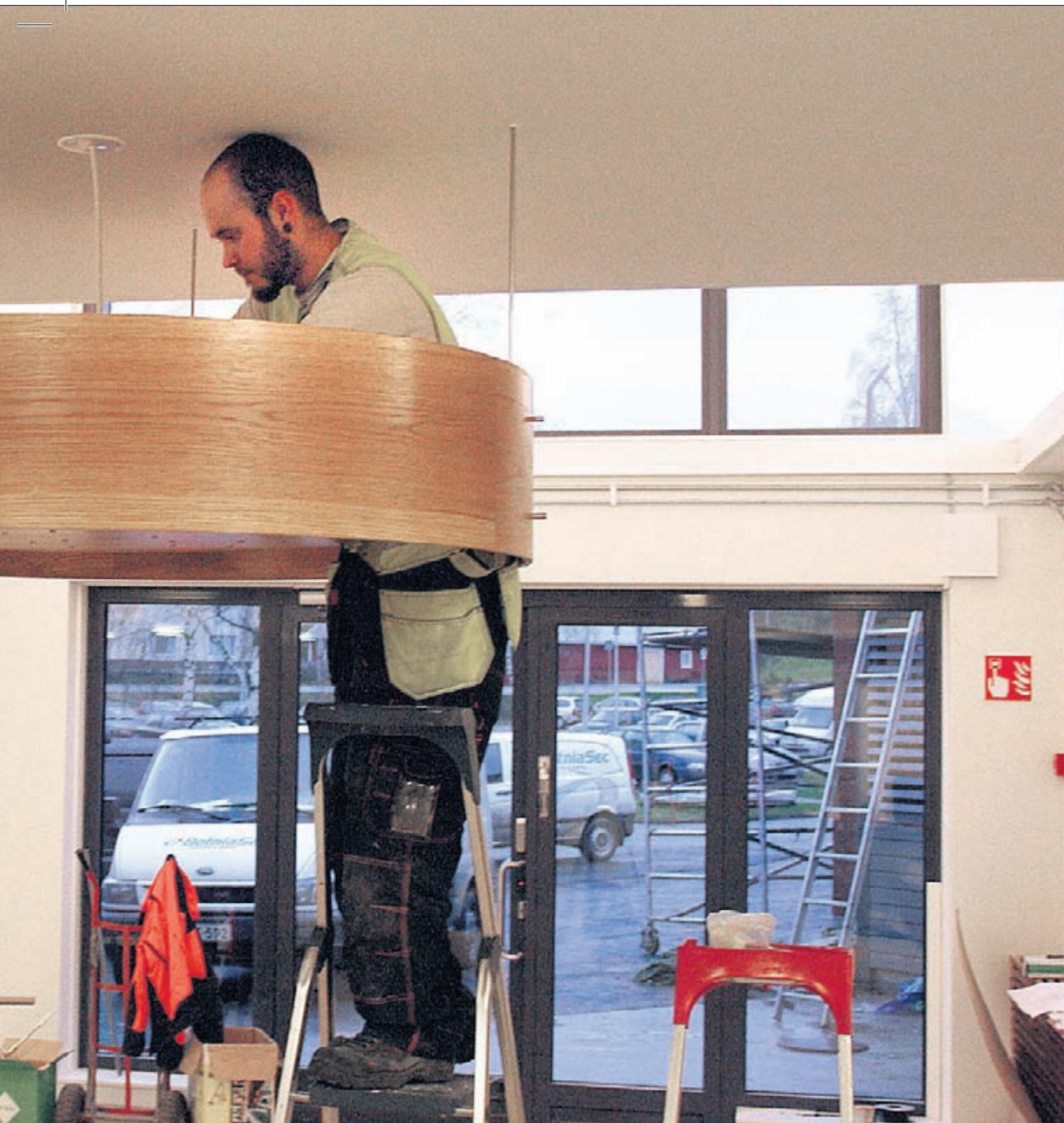
ias konststuderande som har designat lampan och även många andra inredningsdetaljer i Solängen.

mängder på handtagen till de 16 rummen i det nya t är ett tydligt tecken på att allt snart är klart.