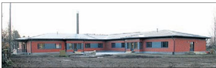
Solängen består av två nästan likadana flyglar med åtta rum i vardera. Det finns en gemensam uteplats på norrsidan av byggnaden.