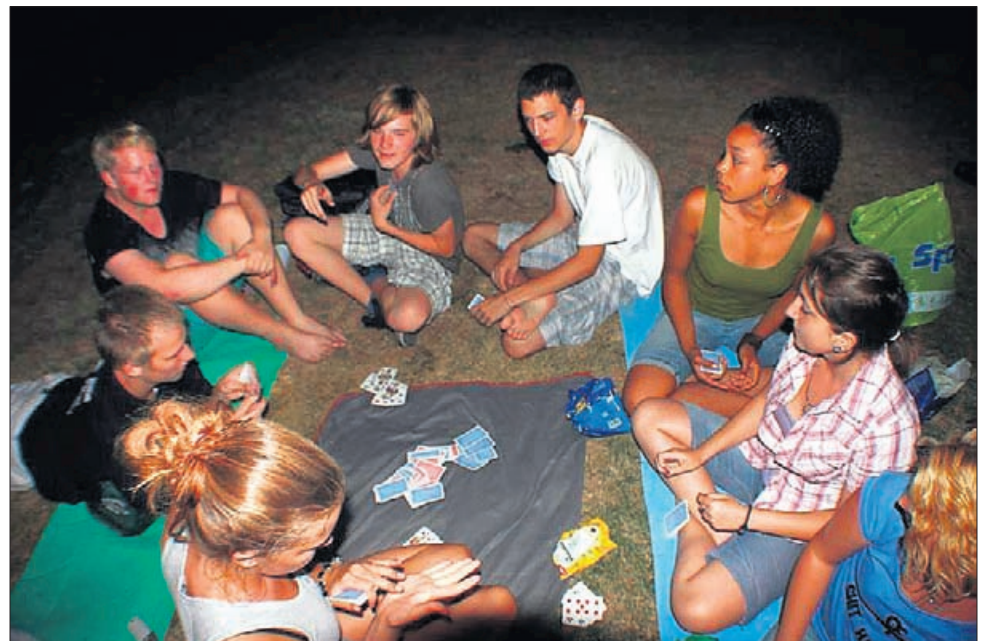
Ungefär 100 ungdomar från 13 olika länder deltog i lägerveckan. Personerna på bilden är från Finland, Norge, Tyskland, Rumänien, Serbien och Ungern.