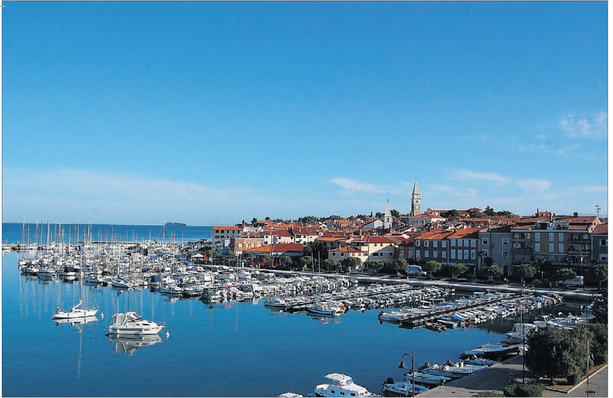
Slovenien är ett vackert land på Adriatiska havets kust. Det här är utsikten över Izola från hotellet ungdomarna bodde på.

Genom att umgås med ungdomar från andra länder, fick fyra österbottningar chansen att se världen genom andras ögon.