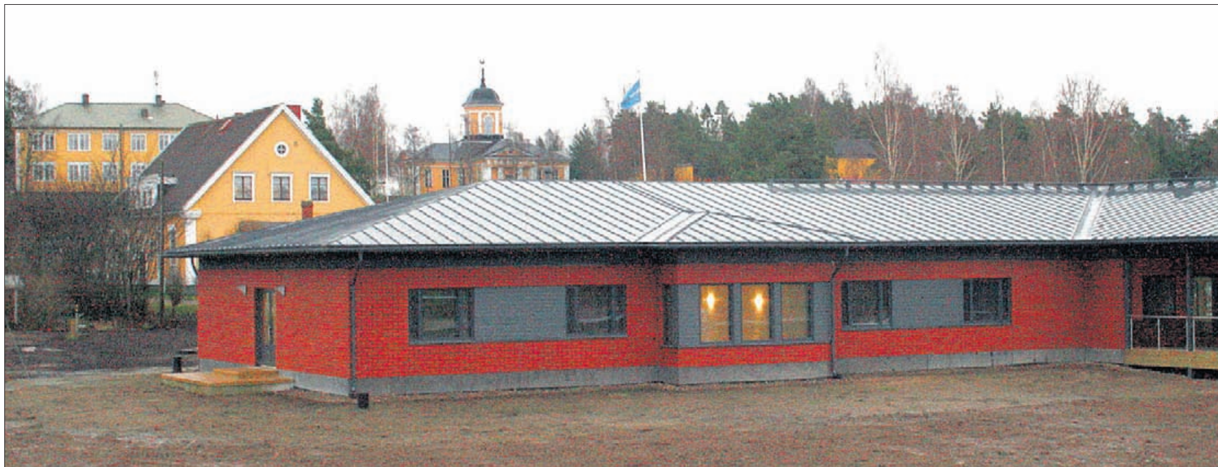
Solängen är byggd i samma stil som hälsovårdscentralen. Läget är centralt, mitt i Oravais kyrkoby.

Nr 10 • Måndagen den 5 december 2011 • Årgång 25